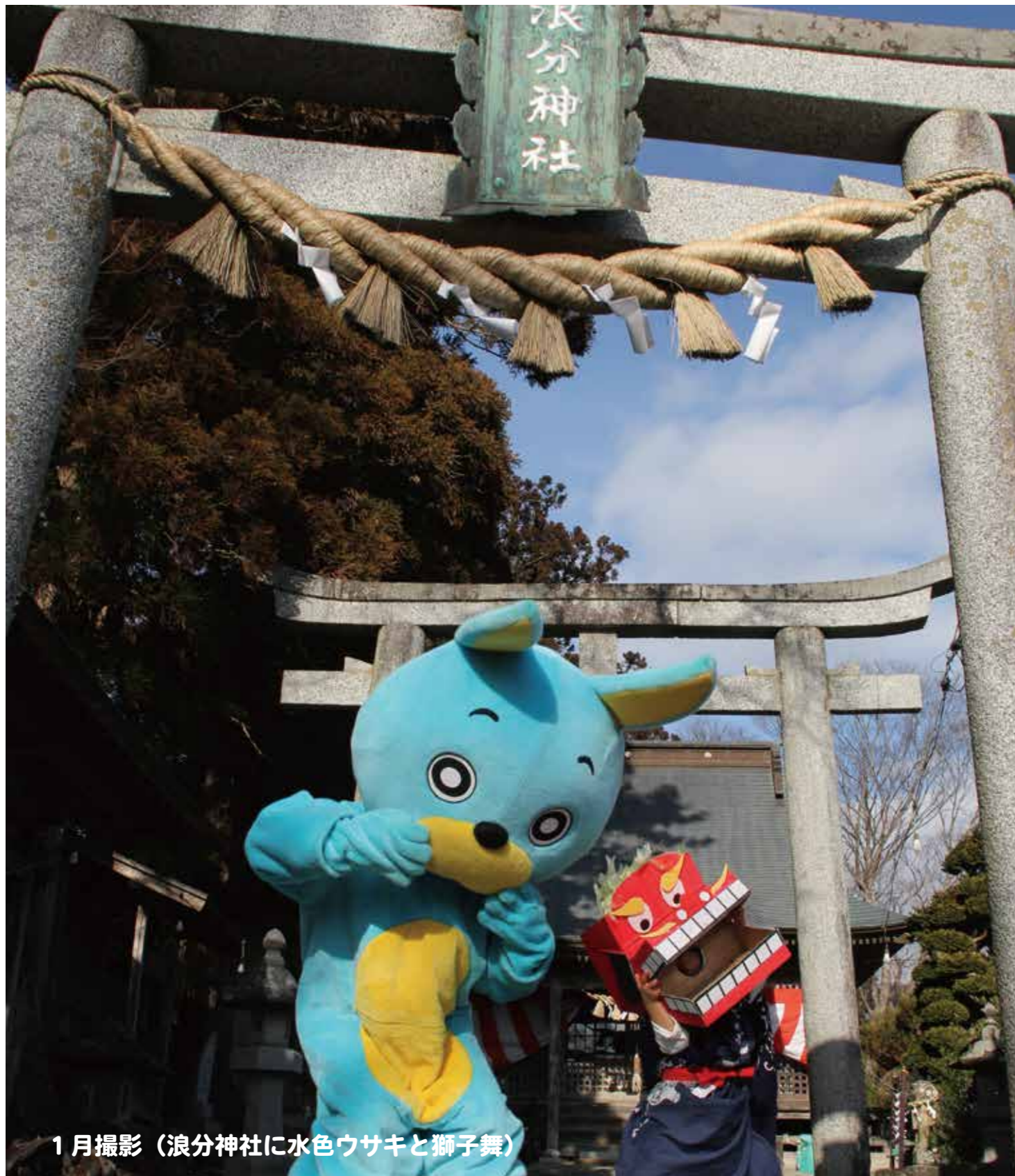
1月撮影（浪分神社に水色ウサキと獅子舞）

This Information Magazine is Always Beside You Stylish&Smiling, Anytime, Anything, By Your Side, With Your Kawasaki Life https://www.facebook.com/kawasaki-machiky