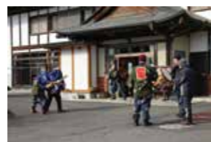
布佐自治会で行われた獅子舞