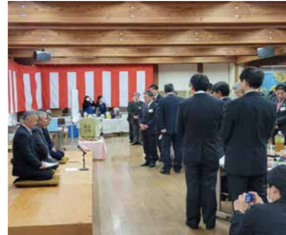
久しぶりの交流のひとつと気を有意義に過ごしました