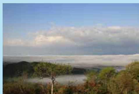
村民憩いの森の石碑から見える雲海