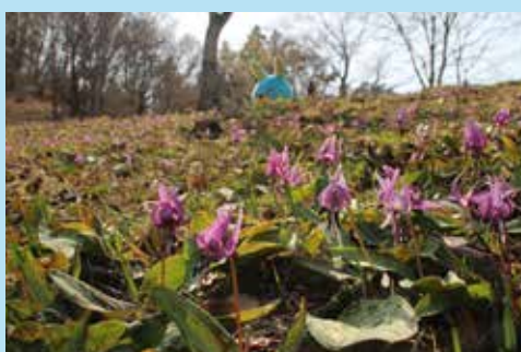
春に咲くカタクリの花