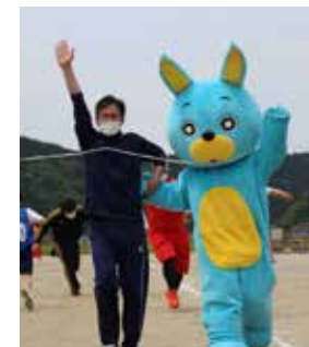
チャンスレースで無事ゴール！

5月13日は川崎中学校体育祭。ウサキもみんなの応援に行ってきたよ。なんと、そこでサプライズ出演！3年生と徒競走したり、チャンスレースに出たり。とても楽しい体育祭の思い出をみんなと作れたよ♪