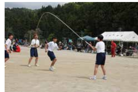
団体戦！長縄に挑戦