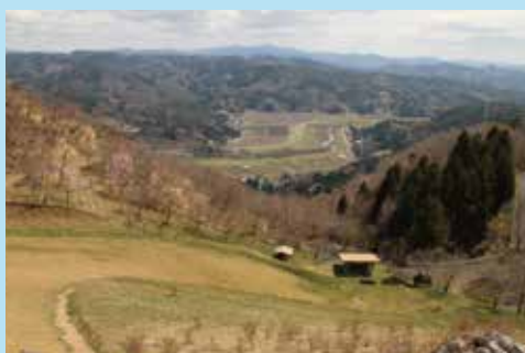
山頂から見る風景

皆さん、一度は訪れたことがある「石蔵山」は標高356mで古くからの信仰の山。春になると桜やカタクリの花が咲き、新緑の季節は草花木々との間からの木漏れ日がとても気持ち良く、訪れる人を癒してくれる場所です。 近年、石蔵山はキャンプ地としても有名で多くの人が訪れています。包想紙を見ながら皆さんのお話のお茶菓子になれば幸いです。