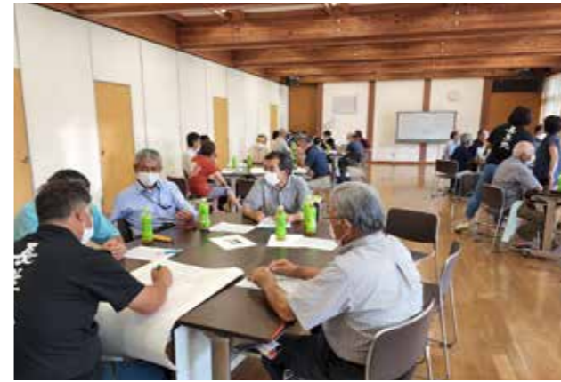
他の自治会の活動についても話が聞ける場となりました

これからの「自治会」について考える 7月29日に川の大楽校地域経営コースを開催し、自治会長を中心として各自治会から1人ずつ参加いただき、「昔と今の自治会の違い」について話し合いを行いました。 昔の自治会はとても盛り上がりがあったという話が聞く一方、今の活動の工夫についても話が出ました。同コースは1月にも開催予定です。来年度にかけて、人口減少や高齢化が進む中で、自治会はどのようにあれば良いか話し合いを進めていきます。