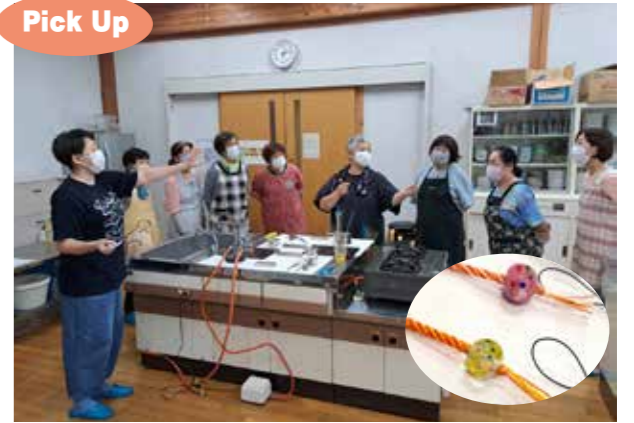
9/26に開催したとんぼ玉教室。色とりどりの作品ができました