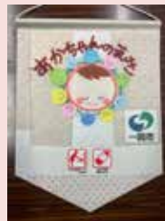
赤ちゃんの駅の標示