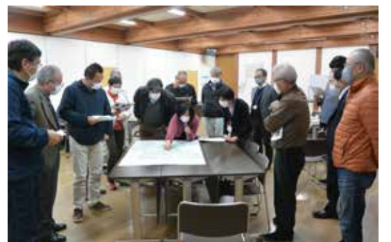
みんなで川崎町内のバリアフリー状況を確認しました