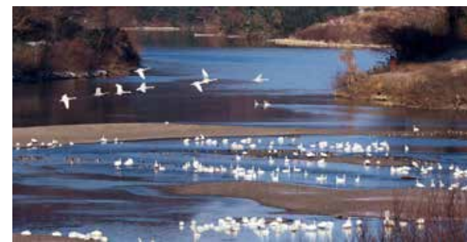
北上川で休む白鳥さんたち (右上にお諏訪さま)

冬の朝、町内中に響き渡る「コーコー」の合唱。北の地に帰っちゃう前に、会いに行ってきたよ！いつか、白鳥さんについて大調査したいなあ。