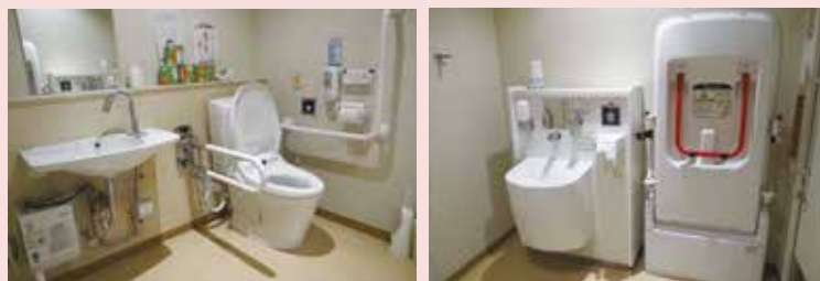
川崎支所の多機能トイレ。介助ベッドも備えています（一番右の設備）