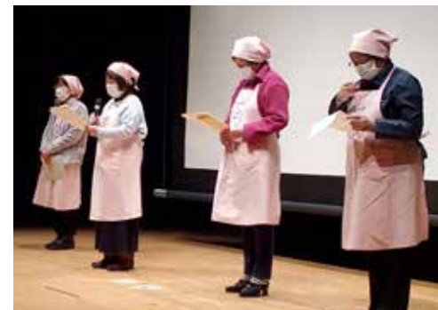
和食の大切さについてお話いただいた食改のみなさん

としてはほつとしました。展示の配置などについていただいた意見については、改善できるかどうか検討を進めていきます。 いただいた意見を参考にしながら、次回も多くの皆さんに楽しんでもらえる川崎文化祭を作っていきたいと思えます。 アンケートにご協力くださった皆さん、ありがとうございます。