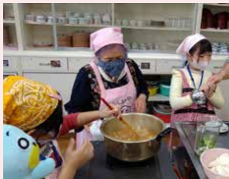
つるくび芋の芋の子汁づくり