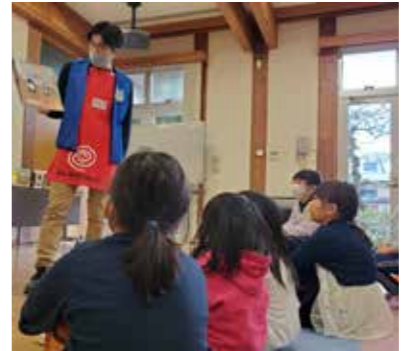
みんな絵本に釘付け！

12月5日、川の楽校のお楽し み会が市民センターで開催さ れ、川崎地域の園児や小学生が オンサンデイズさんの絵本ライ ブとパパ抜き大会で盛り上がり ました。