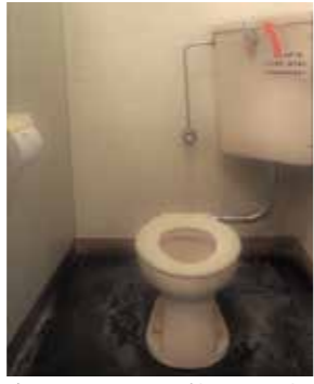
市民センターには子ども用トイレも

川崎支所など関係機関に情報提供しました。まち協でも、情報のもとめ方を含めて、全体会で検討していきます。