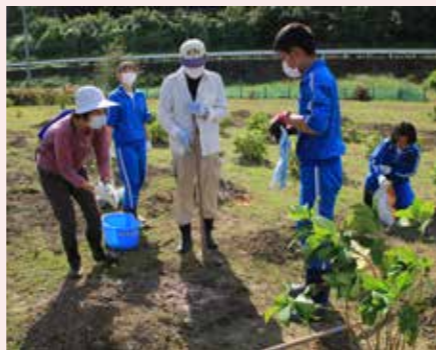
中学3年生のみんながあじさい植樹したよ

ウサキも引き続き取材に行つて、地域のみんなにどんな事業が行われているかお知らせするね。