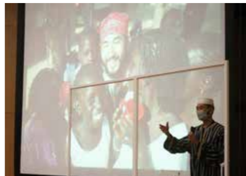
家族5人での自転車世界一周にも挑戦されています

世界を巡った経験談を交えな がら、物事を進める上での人と 人との関わり方やチャレンジす ることの大切さなど、自治会活 動にも生かせる内容をたくさん お聞きしました。