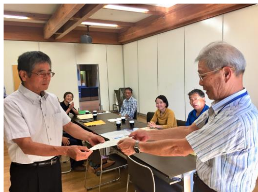
↑認定証と川崎学芸員の名刺をお渡ししました。

現在のテーマは下の5つですが、一つでも多くの宝を残すためにも、今後テーマを増やしていきたいと思っています。